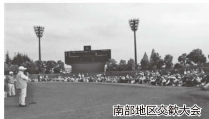
南部地区交歓大会