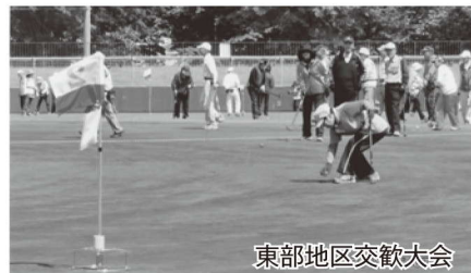
東部地区交歓大会