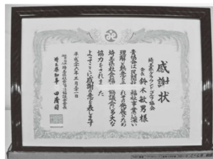
基金贈呈に対する感謝状