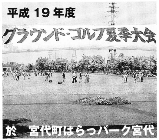
平成19年度 グラウンド・ゴルフ夏季大会 於 宮代町はらっパーク宮代