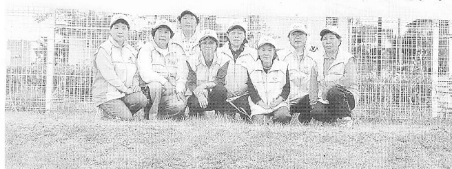
(杉戸町の女性スタッフ)

を急ぐ選手の幾人かが会場後方の駐車場に向かっの離脱。他の選手、役員地元の会場係員に対して、不快さを与えた事を、個々の選手は反省し、次期大会には注意して欲しい。亦、プレー中に雑なプレー、ルール違反となるプレーなどもあった事などの報告もあり、ともに次期大会には楽しい大会であるよう注意して頂きたいと思ひながら、今大会のルポを終わります。 (文責 古谷)