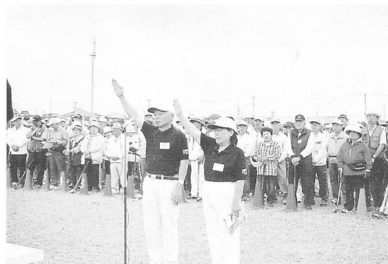
(開会式に於ける選手宣誓)

を急ぐ選手の幾人かが会場後方の駐車場に向かっの離脱。他の選手、役員地元の会場係員に対して、不快さを与えた事を、個々の選手は反省し、次期大会には注意して欲しい。亦、プレー中に雑なプレー、ルール違反となるプレーなどもあった事などの報告もあり、ともに次期大会には楽しい大会であるよう注意して頂きたいと思ひながら、今大会のルポを終わります。 (文責 古谷)