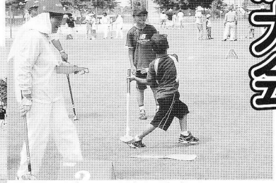
↑飛んだ! 野球じゃないよ。 ←やり直して“ナイスショット!”